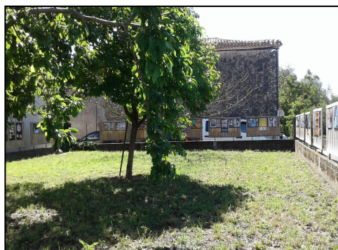
Exposition Jeunes talents 2023 au « verger » de Villesisclé