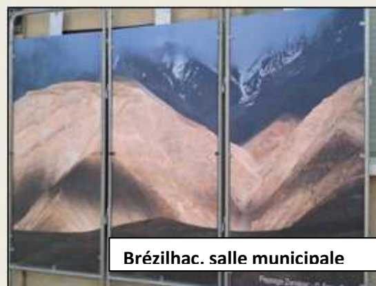
Brézilhac. salle municipale