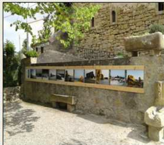
Laurac, place de Dame Guiraud