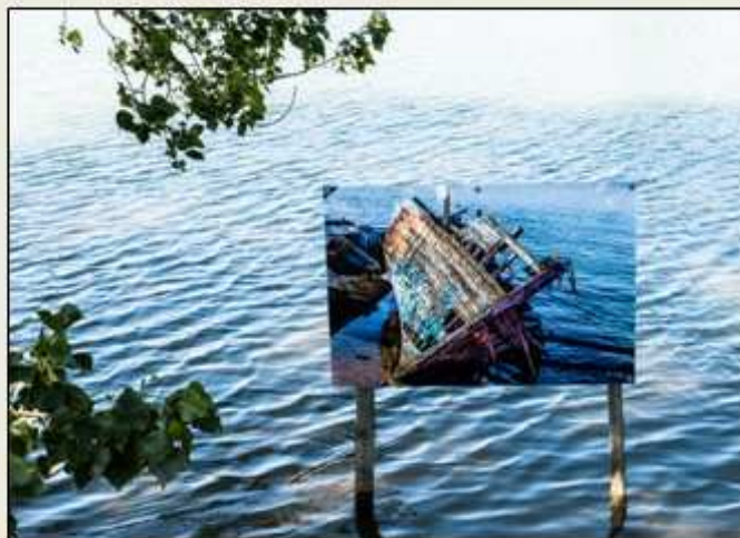
Lac du camping des Bruges