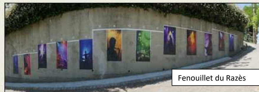
Fenouillet du Razès