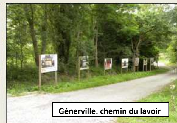
Génerville. chemin du lavoir